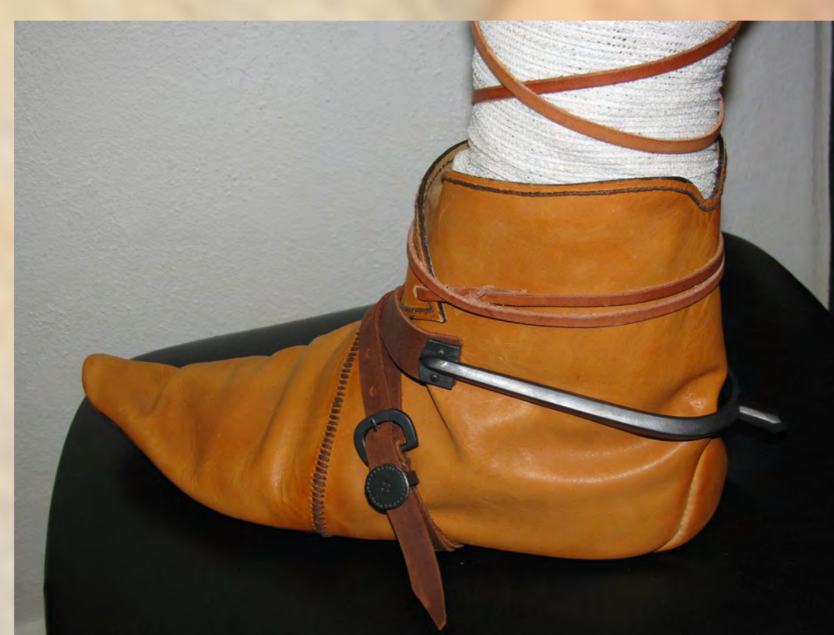
Rekonštrukcia obuvi s ostrohou ako ilustrácia k nálezu ostrôh a ozdobných kovaní remeňov, ktoré sa našli v mieste dolných končatín v hrobe pod mauzóleom.