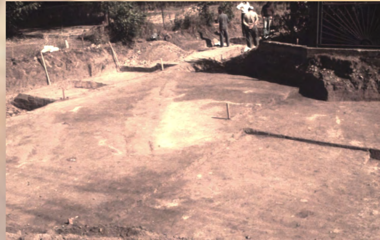
Výklenkový hrob podmolvového typu č. 221 v úrovni zistenia.

V Rakovickej uličke sa tento zvyk zistil v kontexte hrobov z obdobia veľkomoravského a obdobia predveľkomoravského. Okrem stavieb nad hrobmi sa preskúmali i tri pozostatky stavieb samostatne stojacích a rešpektovaných hrobmi.