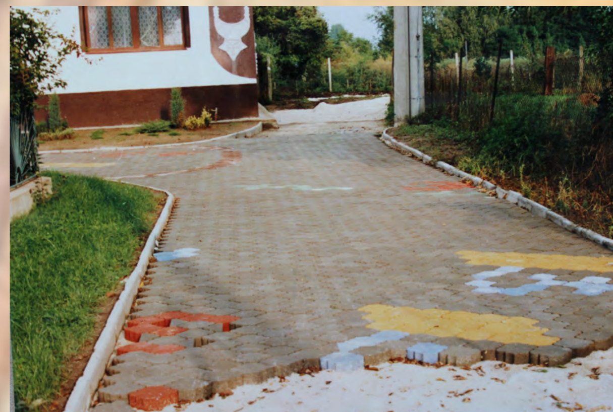
Pohľad na časť Rakovickej uličky vyloženej zámkovou dlažbou s vyznačením miest, kde sa nachádzali hroby. Farby a ornamente umožňujú odlišiť výklenkové hroby od jednoduchých a rozoznať hroby mužov, žien a detí.