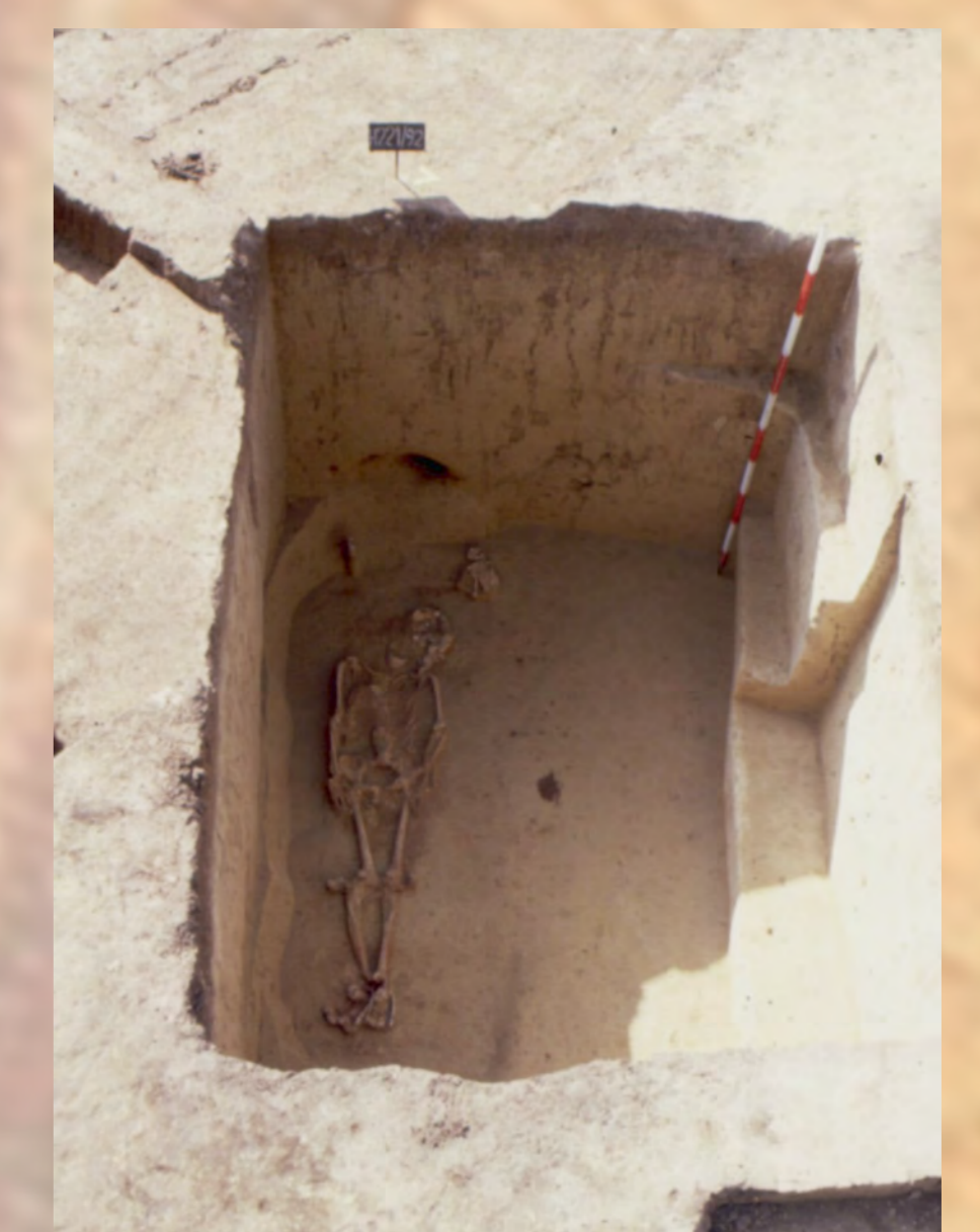
Pohľad do hrobu č. 221 po vypreparovaní kostry mladého muža.