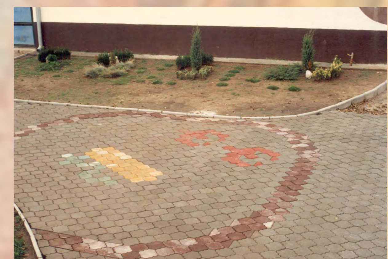
Miesto mauzólea a hrobu č. 221 vyznačené farbami zámkovej dlažby, pokus o vytvorenie stálej prezentácie pohrebiska v Rakovickej uličke.