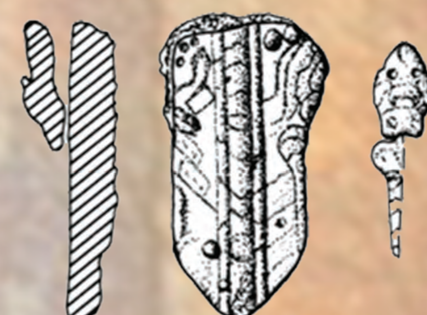
Kresba výzdoby kovania remeňa z hrobu s mauzóleom.