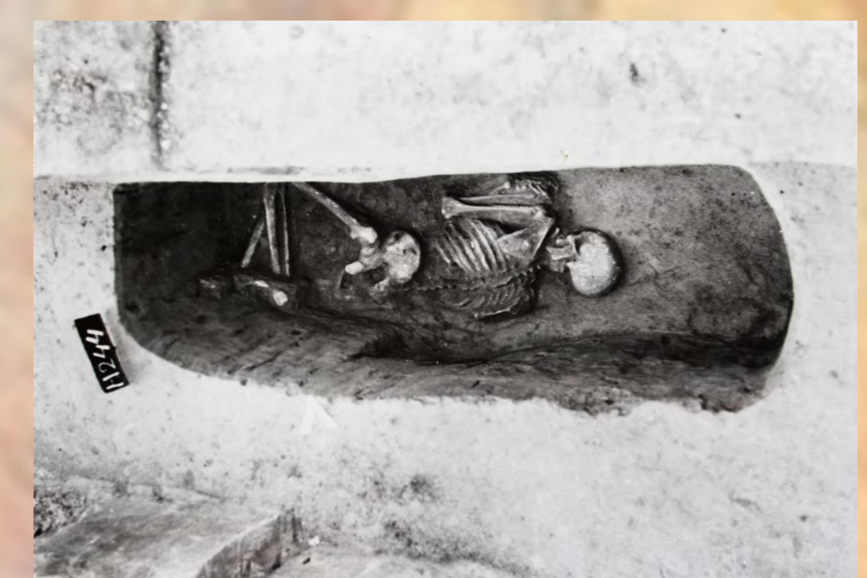
Nepietna poloha kostry ženy v hrobe č. 244 súvisí s násilným usmrtením a následným vhoďením do hrobu. Ide o obrad vykonaný v súvislosti s pohrebom muža v mauzóleu.