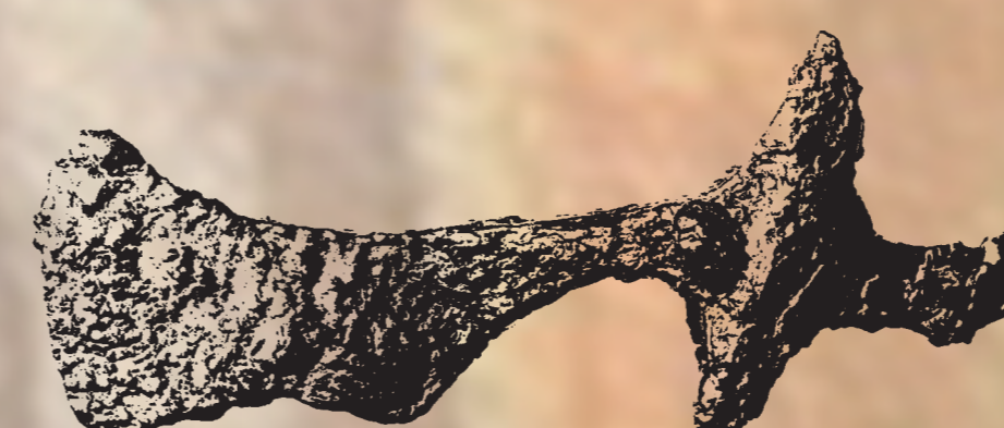
Sekera v hrobe č. 221 mala na povrchu technologicky neznámu látku, ktorá slúžila na vytvorenie ornamentov.