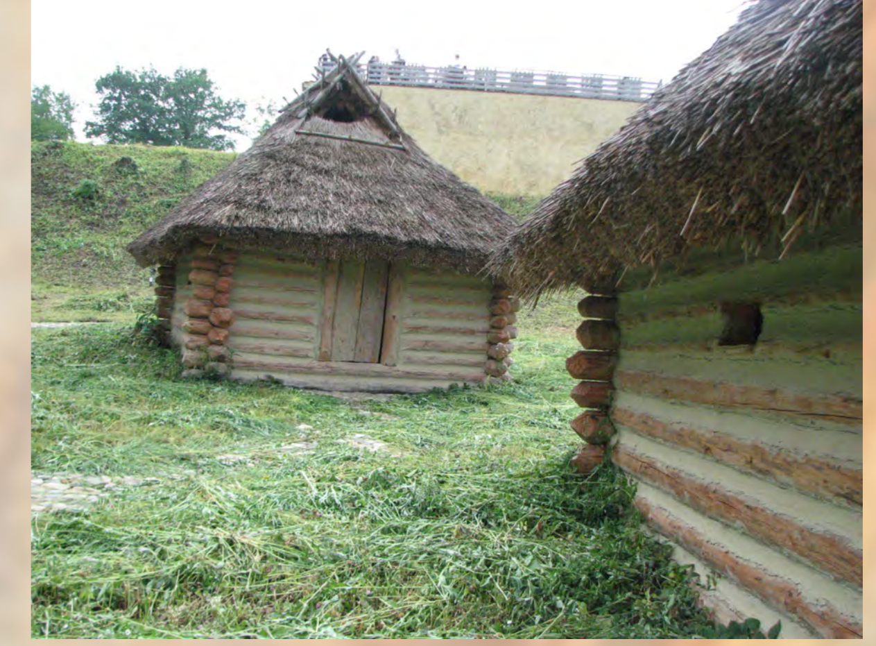
Replika zrubovej stavby z obdobia včasného stredoveku.