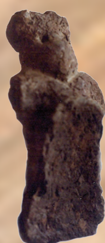
K vzácnym nálezom z mladšej doby kamennej patrili z hliny vymodelované a vypálené sošky.