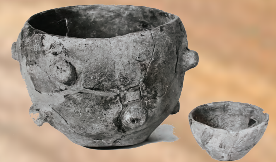
Nádoby z mladšej doby kamennej boli rôznych veľkostí, robené v ruke a zdobené plastickými výčnelkami alebo rytým ornamentom.