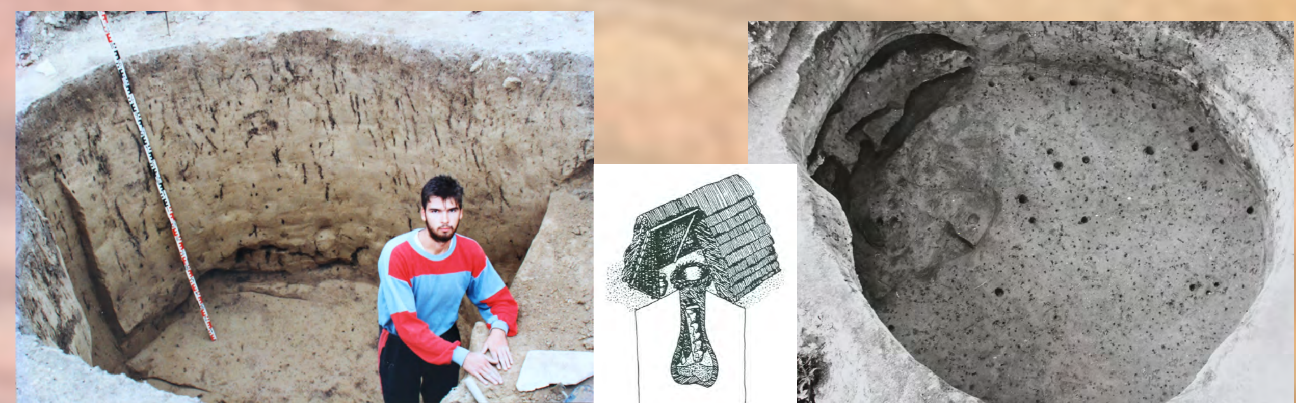
Zásobnú jamu vykopanú do spráše a určenú na uskladnenie najčastejšie obilia môžeme na Považí nazvať zvykom starým 8 000 rokov. Poznáme ich v mladšej dobe kamennej ale aj v stredoveku. Ešte dnes sa na obilné jamy rozpamätajú niektorí starší obyvatelia Boroviec a okolitých dedín.