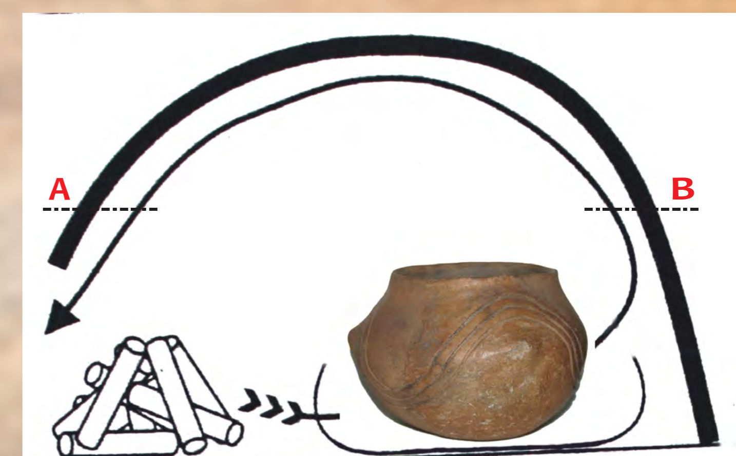
Pozostatok pece z mladšej doby kamennej preskúmanej na pozemku pána Popelku a ilustrácia, ako fungovala.