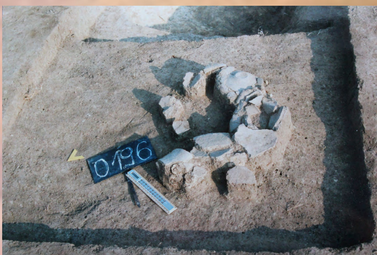
Nádoby z mladšej doby kamennej sa nachádzali v črepoch.