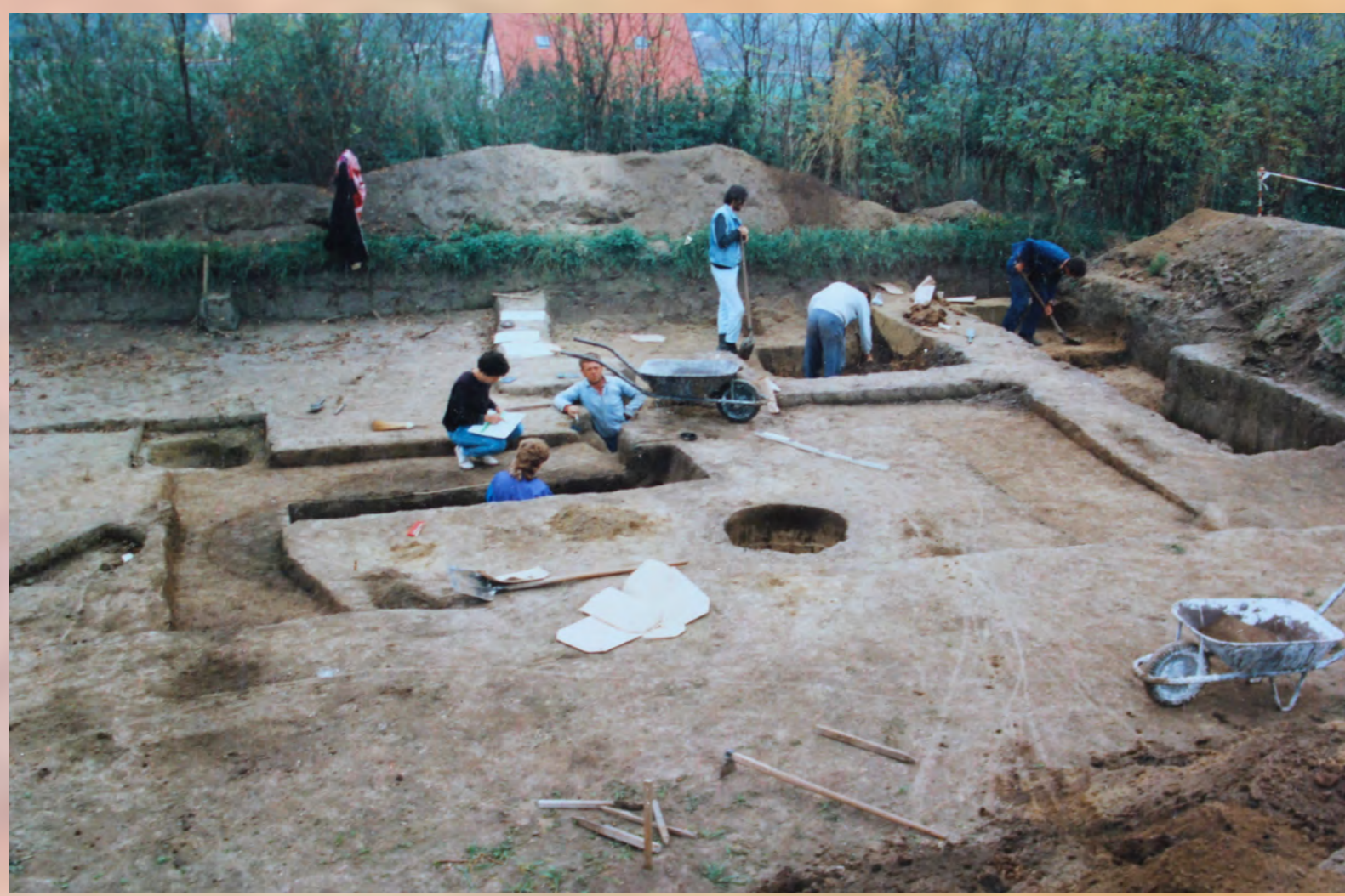
Na Chríbe sa nachádzali vedľa seba objekty z doby kamennej i oveľa mladšie stredoveké pozostatky dielni.