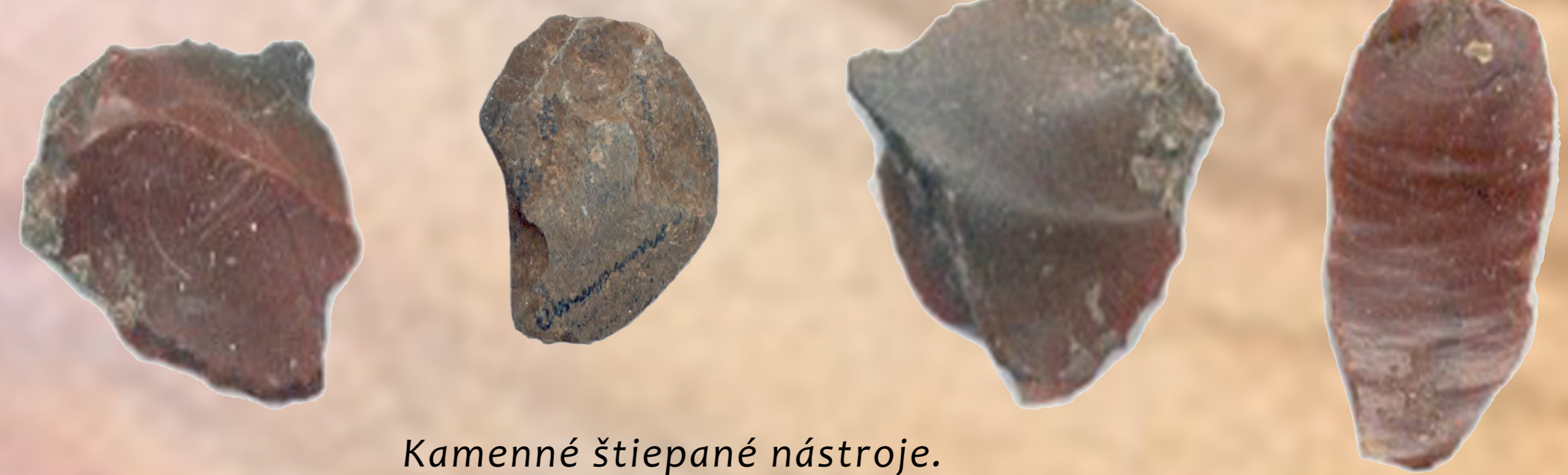
Kamenné štiepané nástroje.