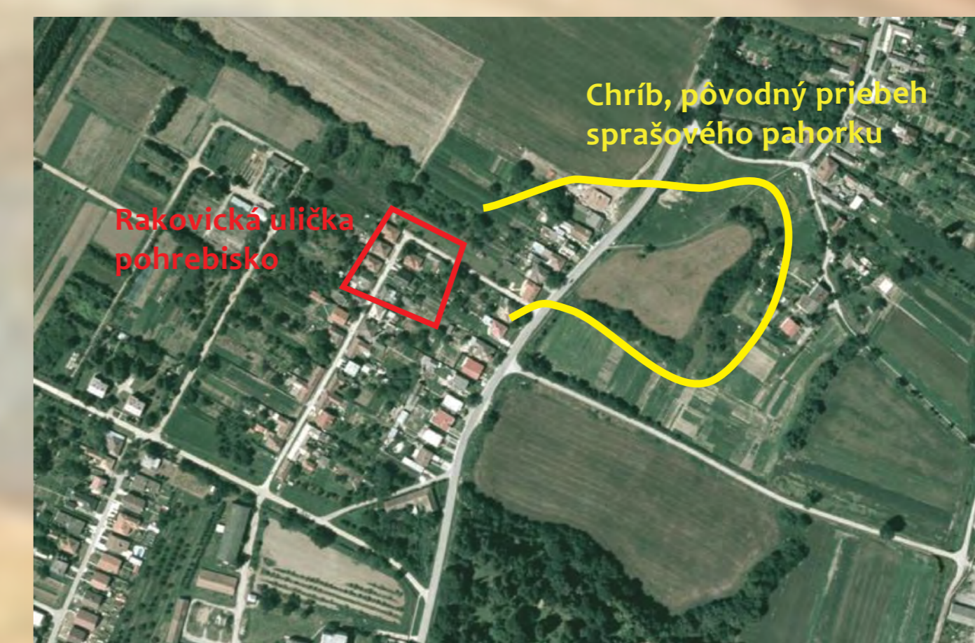
Ortofoto mapa časti Boroviec s vyznačením rozsahu pohrebiska v Rakovickej uličke a pôvodný priestor Chríbu – sprášového pahorku Trnavskej sprášovej pahorkatiny.