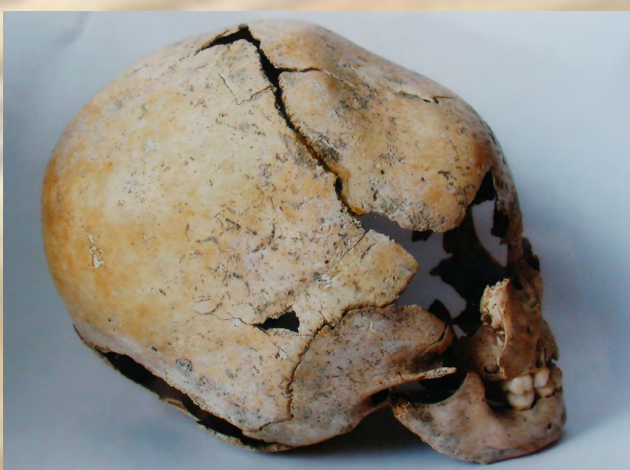
Detská lebka s umelou deformáciou, ktorá sa dosiahla bandážovaním hlavy dieťaťa. Nález z Chríbu z roku 1985.