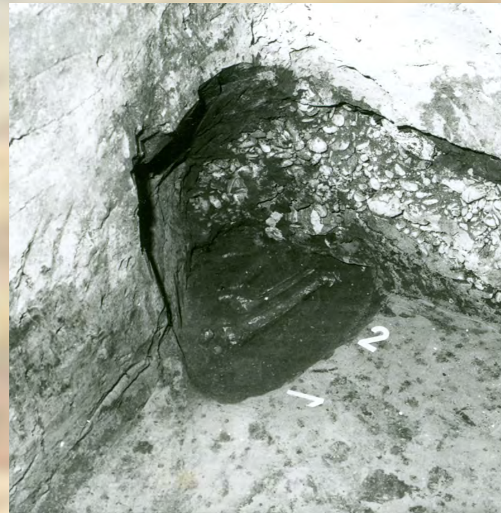
Hrob čiastočne zničený základmi domu. Záchranný výskum v roku 1985.