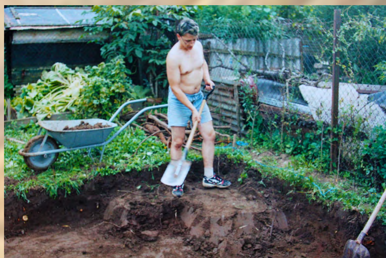
Hroby sa nachádzali aj v hĺbke 55 cm od dnešného povrchu. Ničili ich nielen stavby ale aj sadenie či vykopávanie stromov. Preskúmanie pohrebiska bolo teda nielen vedecky dôležité, ale pre záchrany archeologických pozostatkov aj nevyhnutné.